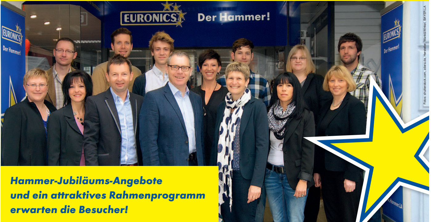
Fotos: shutterstock.com, zdfara.de, Hersteller: Wank & Winkl, BAYEEL.A

Hammer-Jubiläums-Angebote und ein attraktives Rahmenprogramm erwarten die Besucher!