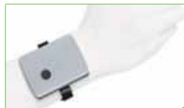
GPS-Sender und -Empfänger mit Notruffunktion als Armbandlösung.