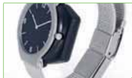
Ausführung als Armbanduhr mit durchschneidesicherem Metallarmband und Patentverschluss.