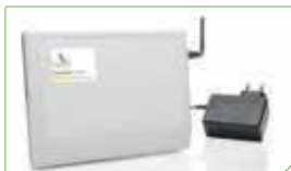
Empfangseinheit mit Funkmodem, das die Signale von Bewegungsmeldern, Türkontakten und Alarmnotrufarmband verarbeitet.

Durch ein innovatives Geräte-Energiemanagement werden die Akku- und Betriebslaufzeiten der Geräte verlängert. So erkennt der GPS-Sender, wenn er sich Im Wohnungsbereich befindet und schaltet sich automatisch ab. Nach Verlassen der Wohnung erfolgt eine automatische Aktivierung.