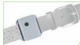
GPS-Sender und -Empfänger mit Notruffunktion zum Tragen am Gürtel.